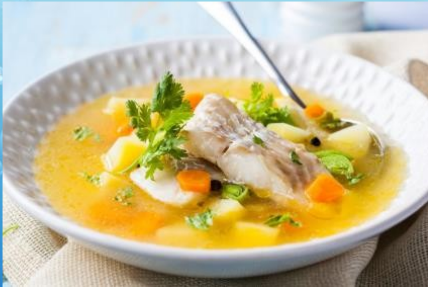
Рыбный суп (уха)