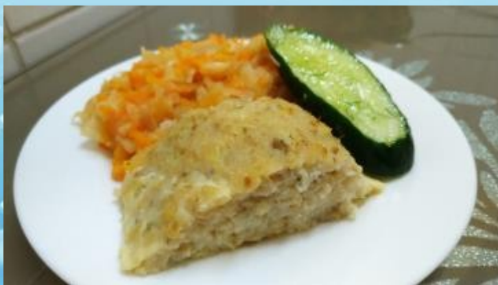
Рыбная запеканка с тушеными овощами